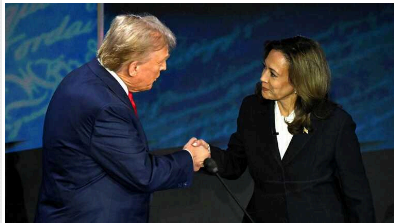
Reuters: Трамп і Гарріс мають однакові шанси у Пенсільванії

Виборці штату Пенсільванія в США віддали невелику перевагу кандидатці в президенти Камалі Гарріс. Похибка складає плюс-мінус 3%.