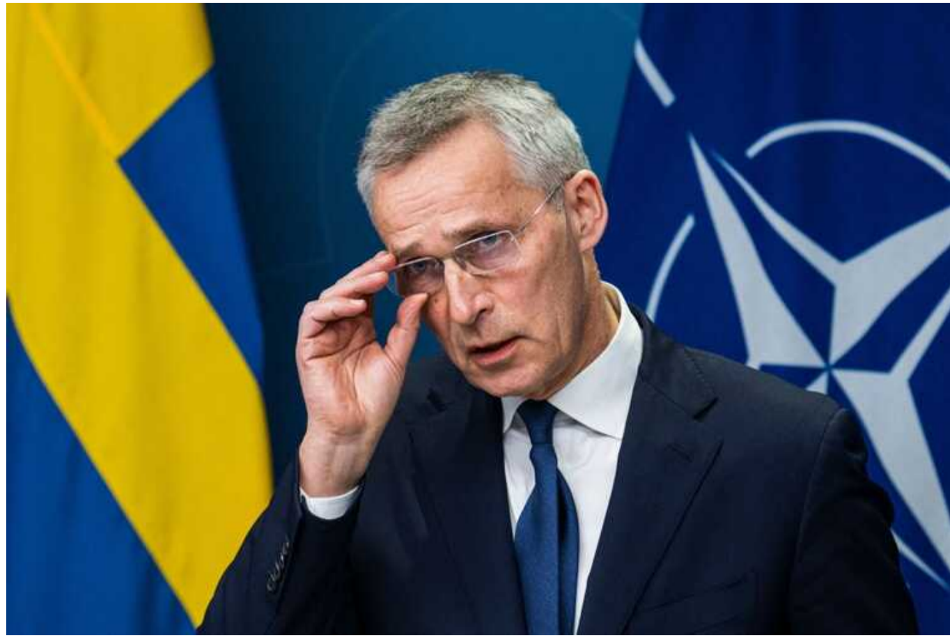
Що більше зброї ми дамо Україні, то швидше прийде мир, - Столтенберг

Генеральний секретар НАТО Єнс Столтенберг вважає, що Захід може наблизити кінець війни в Україні, якщо збільшить військову допомогу Києву.