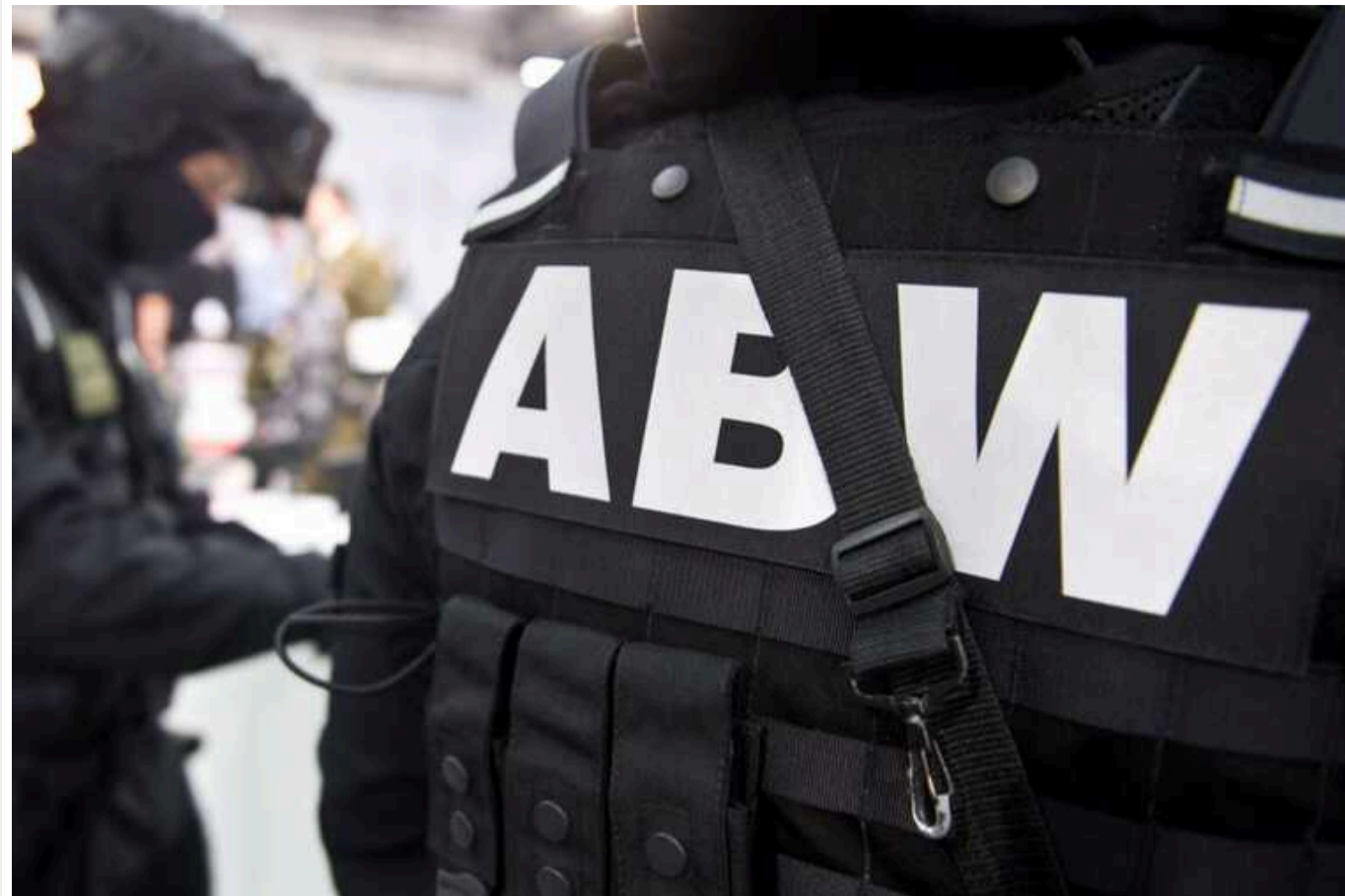
У Польщі затримали "псевдовійськового", який розповсюджував фейки про підриви дамб

Співробітники Агентства внутрішньої безпеки Польщі арештували чоловіка, який у військовій формі заявляв мешканцям населених пунктів на півдні про нібито плани влади підірвати дамби та вали.