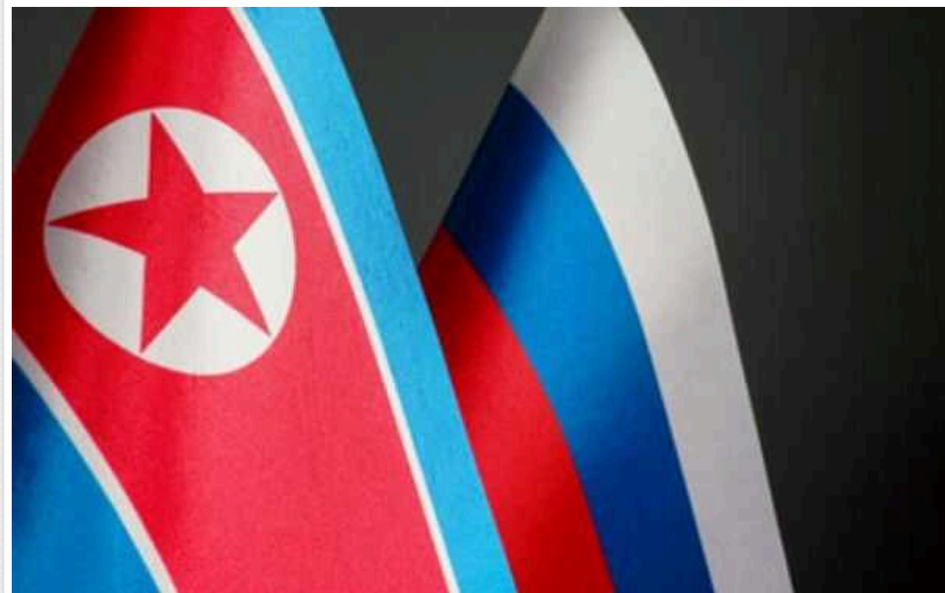
США розкрили канал фінансової співпраці між РФ та КНДР

19 вересня, у четвер, Міністерство фінансів США оголосило про запровадження санкцій стосовно фізичних та юридичних осіб, які беруть участь у незаконних фінансових операціях між Росією та Північною Кореєю.