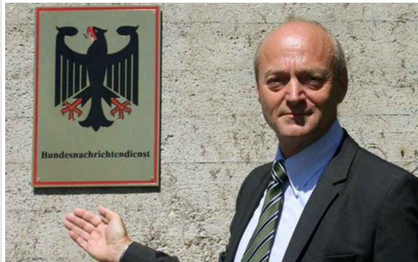
Колишній глава розвідки ФРН назвав операцію Ізраїлю з підриву електроніки бойовиків «видатною»

Таку оцінку діям Ізраїлю дав ексголова Федеральної розвідувальної служби Німеччини (БНД, зовнішня розвідка) Герхард Шиндлер.