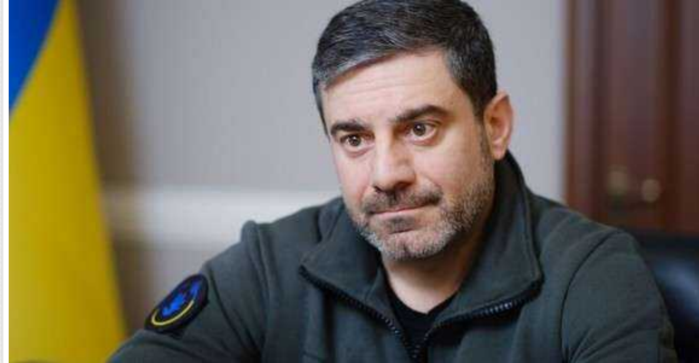
Лубінець відреагував на інцидент із побиттям дівчини в інтернаті в Коломиї

Працівниця жіночого психоневрологічного інтернату в Коломиї побила свою підопічну.