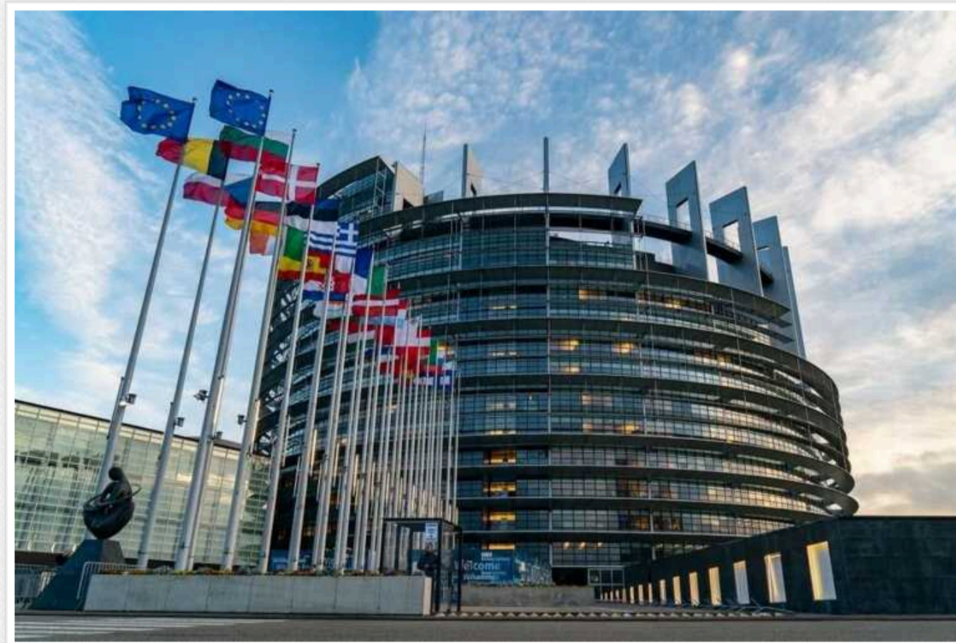
В Європарламенті закликали зняти обмеження на використання Україною далекобійного озброєння по території РФ

Європейський парламент закликав країни-члени Європейського Союзу зняти обмеження на використання західного озброєння для ураження цілей на території Росії в інтересах України.