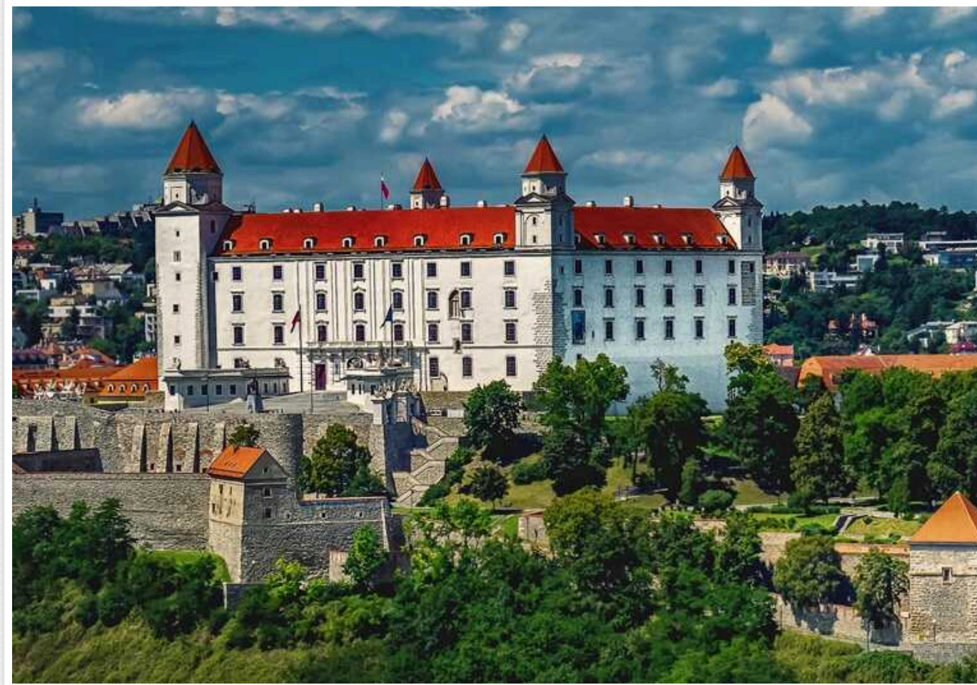
На сайті громади словацького села влаштували збір на допомогу жителям Курщини

Натомість громадяни Словацької Республіки почали надсилати по євроценту з повідомленнями "Слава Україні" та "Смерть ворогам".