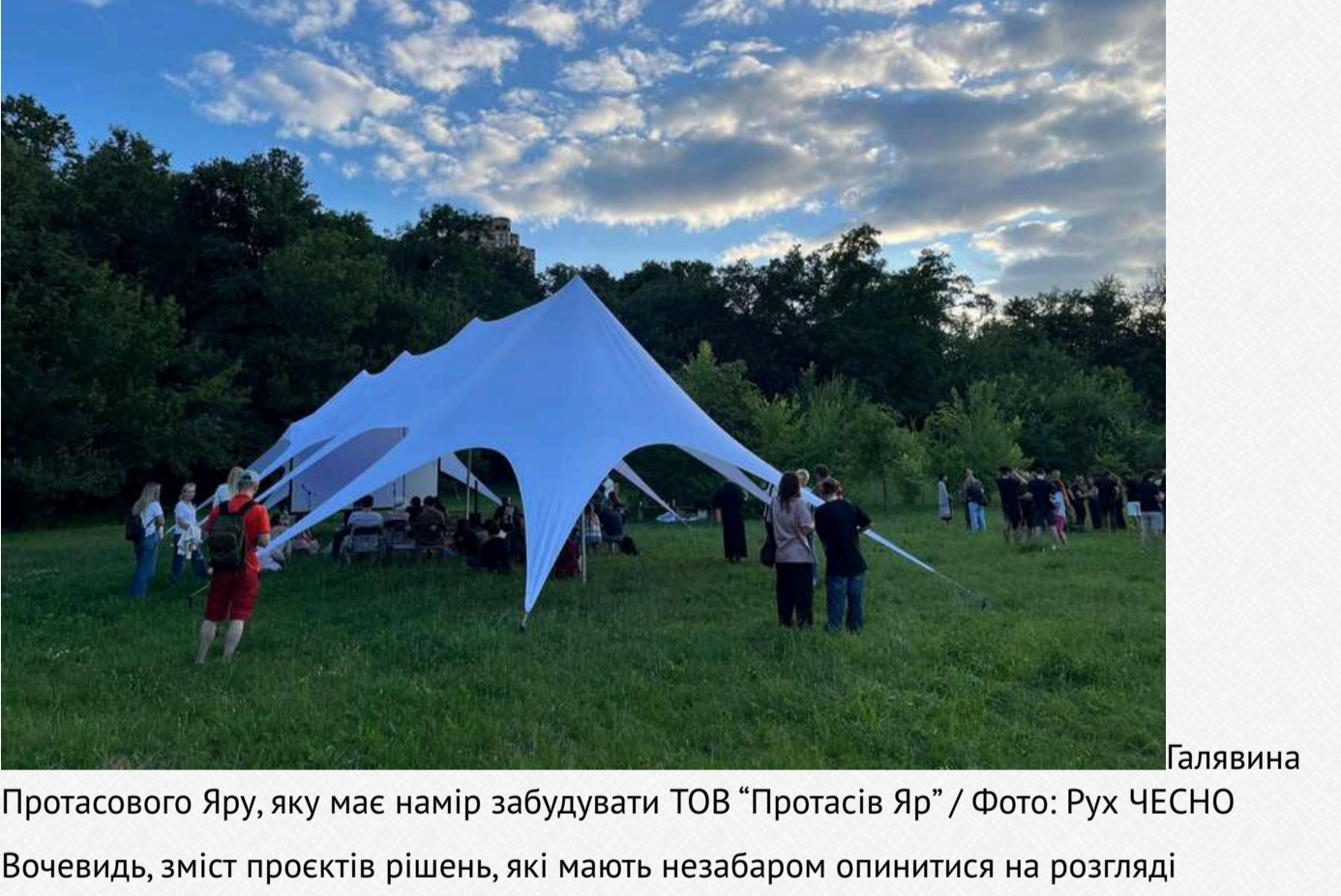
Протасівого Яру, яку має намір забудувати ТОВ «Протасів Яр»