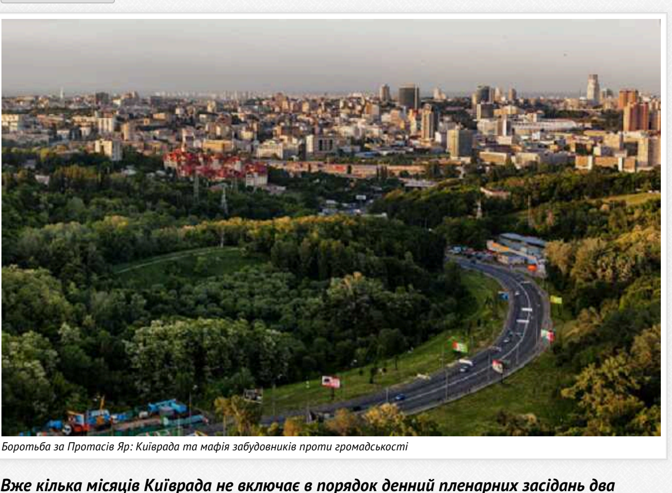
Борьба за Протасів Яр: Київрада та мафія забудовників проти громадськості

Вже кілька місяців Київрада не вклучає в порядок денний пленарних засідань два проєкти рішень про захист ландшафтного заказника «Протасів Яр» імені Романа Ратушного.