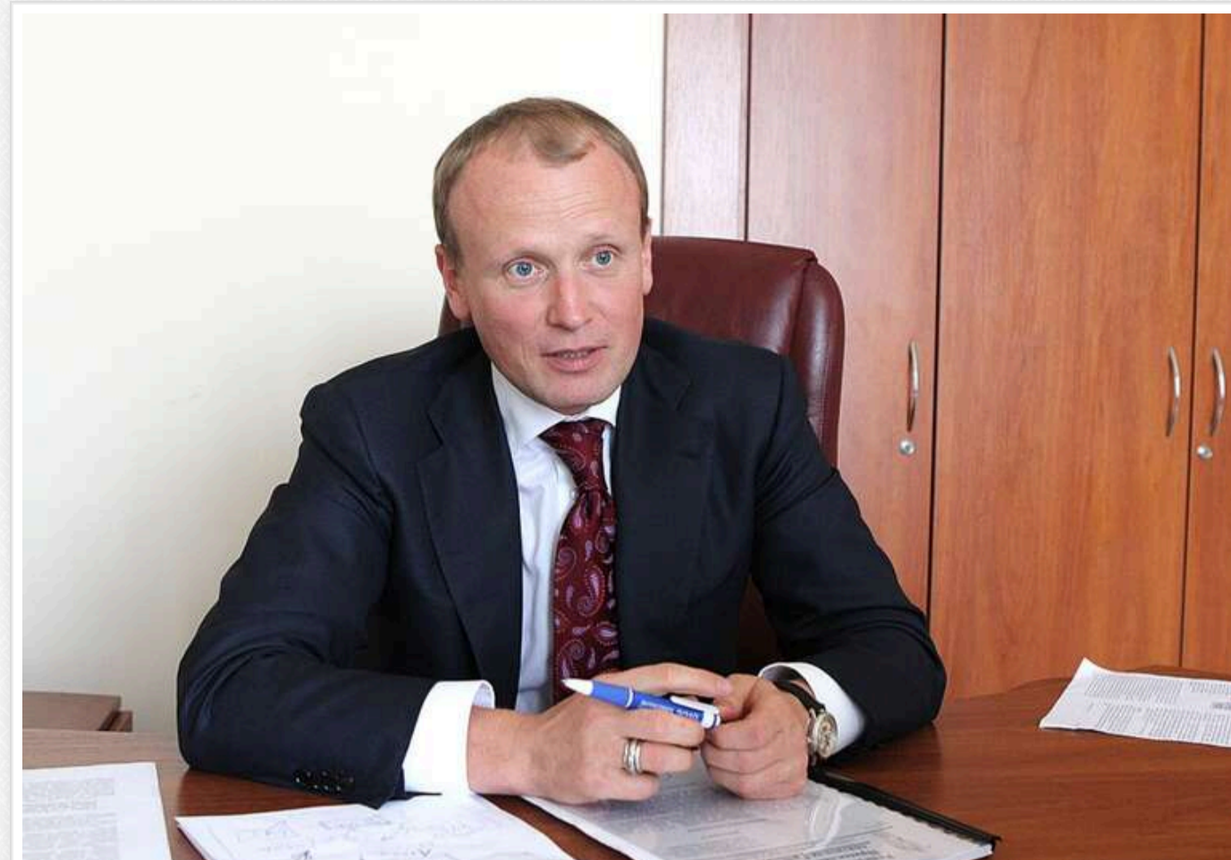
Полярна схема: Компанію "Трансхаус", пов'язану з банкіром Олексієм Омелянченком, звинувачують у захопленні землі в Києві

У Києві земельну ділянку на Оболоні може отримати компанія, яку пов'язують зі скандальним банкіром Олексієм Омелянченком. Раніше таким же чином "розділили" ще одну пов'язану з "Укргазбанком" ділянку.