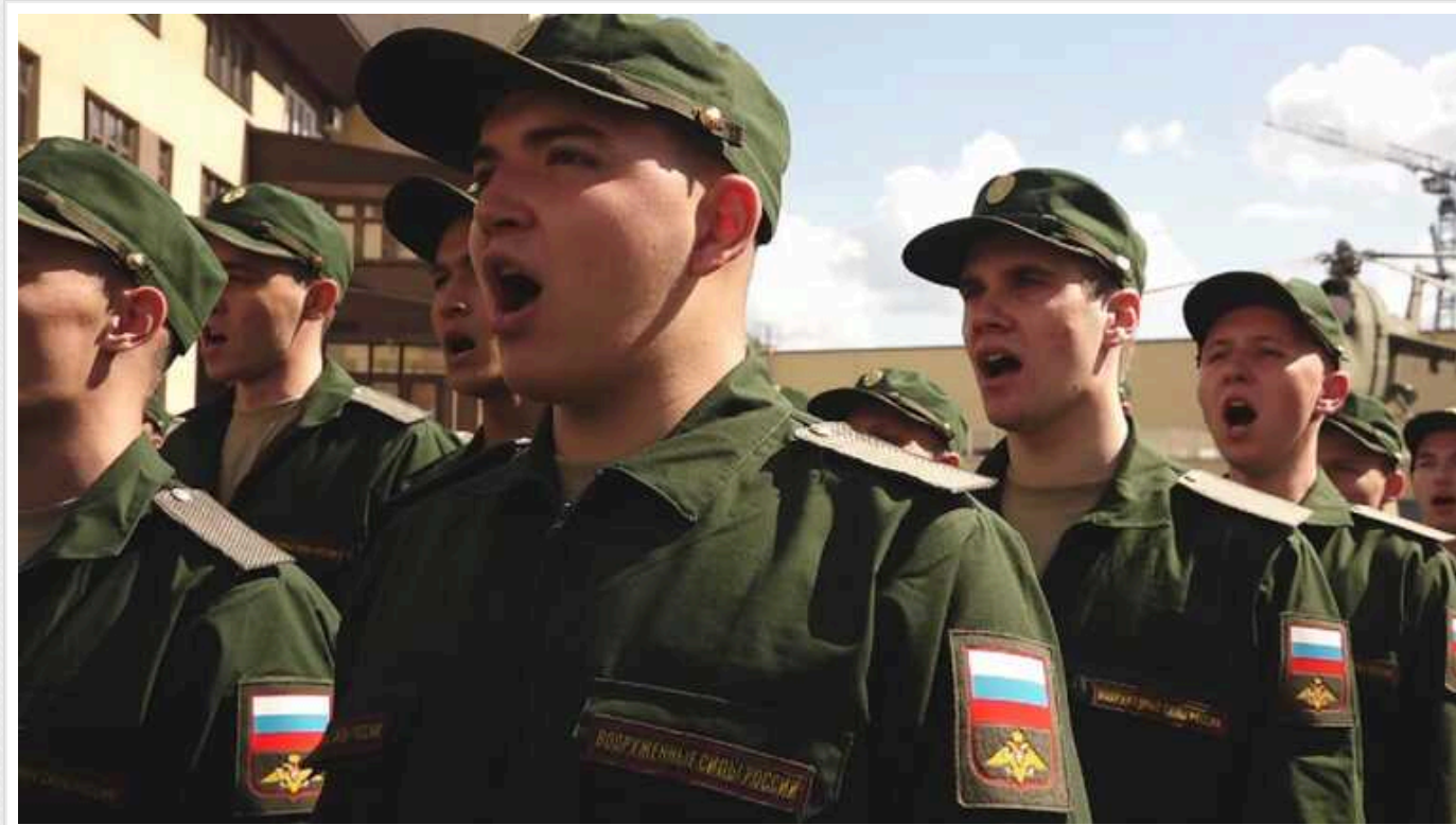
В РФ запустили реєстр електронних повісток

Влада країни-агресорки сформувала реєстр електронних повісток. Він функціонує в тестовому режимі.