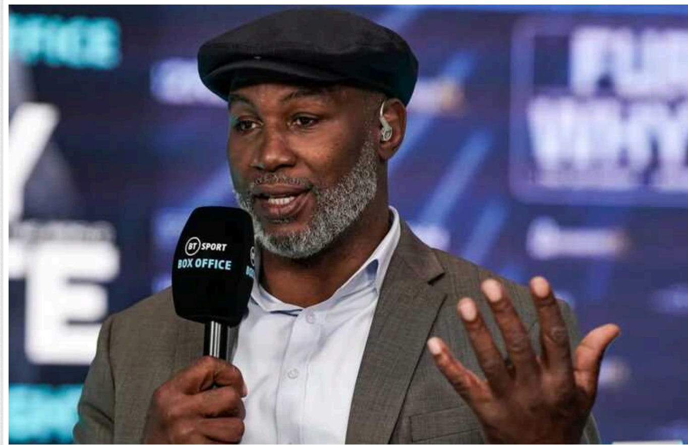
Легенда боксу Леннокс Льюїс прокоментував реванш Усик – Ф'юрі

Колишній абсолютний чемпіон світу в суперважкій вазі Леннокс Льюїс із нетерпінням чекає на реванш між Олександром Усиком (22-0, 14 КО) та Тайсоном Ф'юрі (34-1-1, 24 КО). Легенда боксу зізнався, що йому важко зробити однозначний прогноз на поєдинок, проте його співвітчизник намагатиметься виправити помилки, допущені під час бою 18 травня.