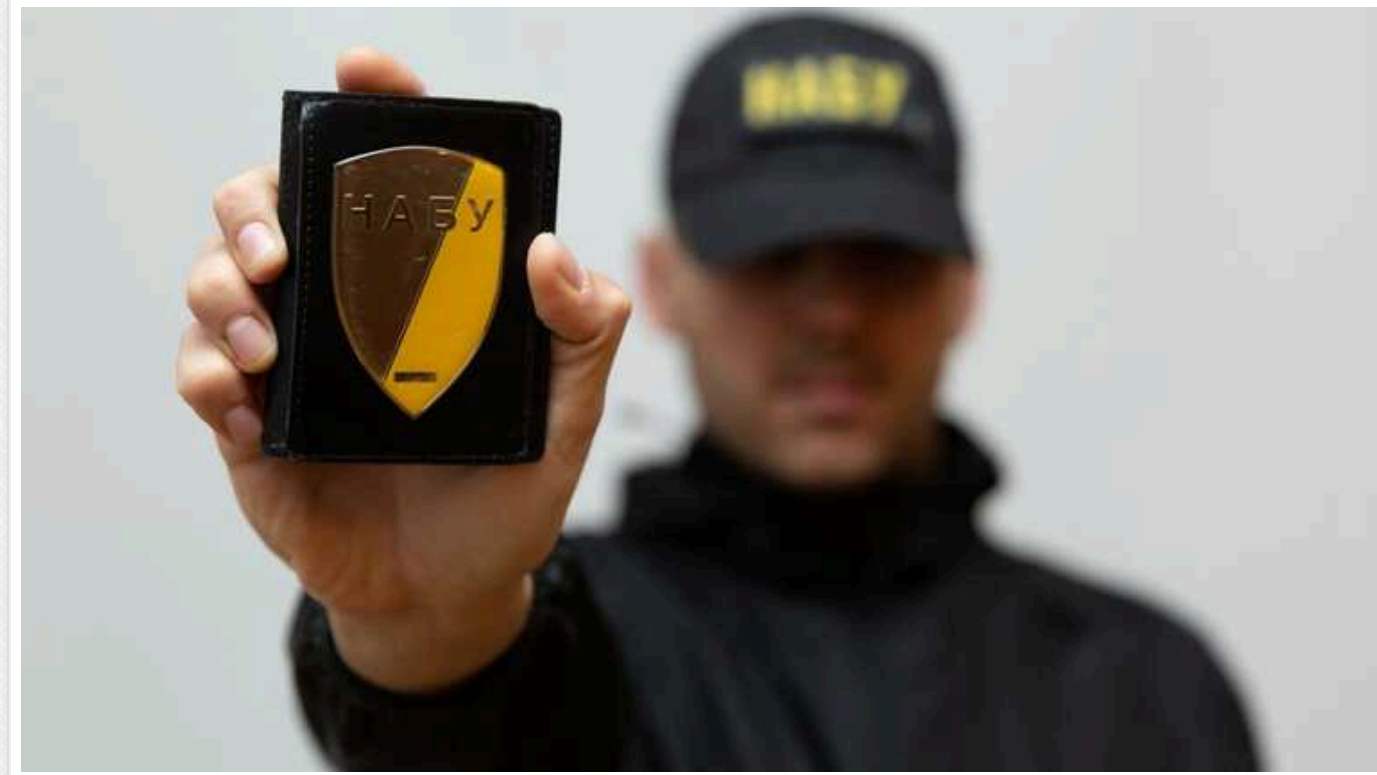
У справі ексголови Фонду держмайна нова підозра: завдали державі збитків на суму 700 мільйонів гривень

НАБУ та САП повідомили про підозру ще одному учаснику злочинної організації, очолюваної ексголовою ФДМУ, діяльність якої призвела до збитків державі на понад 700 млн грн, а викриття стало одним із найуспішніших в історії антикорупційних органів.