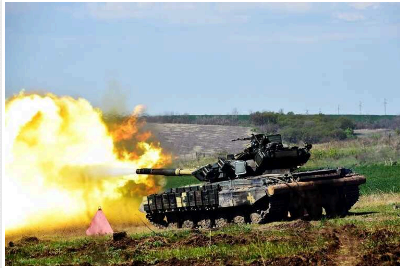
ЗМІ пишуть, що в РФ у Курській області 37 тисяч військових: хочуть до 15 жовтня витіснити ЗСУ

У Курській області Росія зосередила 37 тисяч солдатів. Російська влада поставила завдання своїм військам до середини жовтня витіснити ЗСУ.