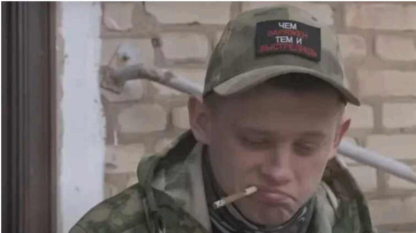
У Швейцарії планують показати фільм "Росіяни на війні": МЗС висловило протест

На швейцарському кінофестивалі Zurich Film Festival вирішили показати скандальний фільм російської режисерки Анастасії Трофімової "Росіяни на війні". Міністерство закордонних справ України висловило протест та обурення таким рішенням.