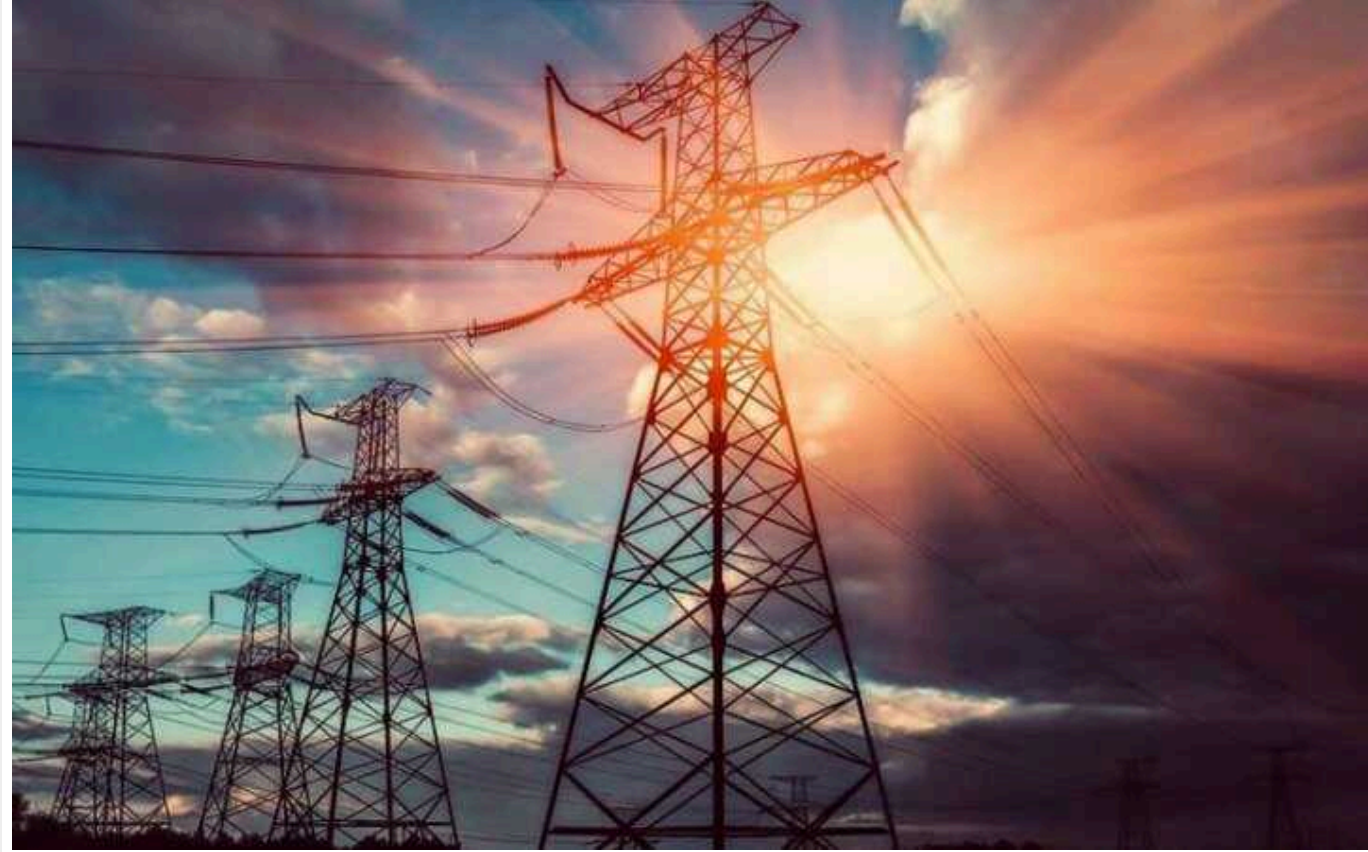
Проект з постачання польської електроенергії Україні «заморожено», – ЗМІ

Проект виробництва електроенергії Польщею для України на даний момент не було реалізовано, він фактично знаходиться в замороженому стані.