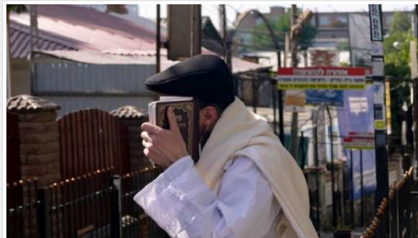
На святкування Рош га-Шана до Умані вже прибули до пів тисячі хасидів

До Умані перед святкуванням Рош га-Шана вже приїхало близько пів тисячі хасидів, а масовий приїзд паломників очікується з наступного тижня.