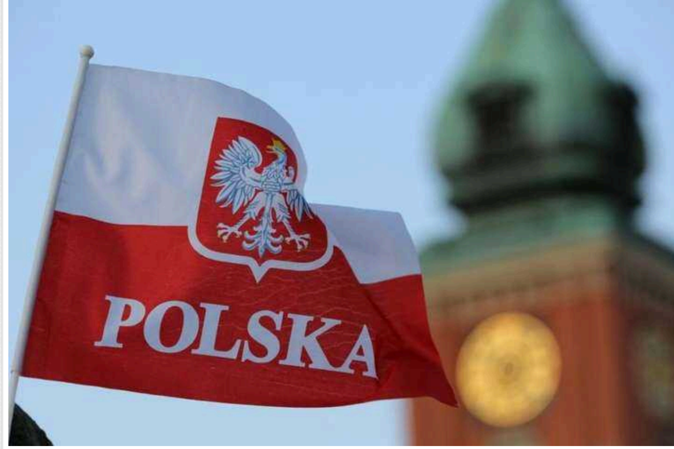
У Польщі планують тиснути на Україну з метою ексгумації жертв Волинської трагедії

Польща планує скористатися своїм майбутнім головуванням у Євросоюзі для тиску на Україну з метою ексгумації жертв Волинської трагедії.