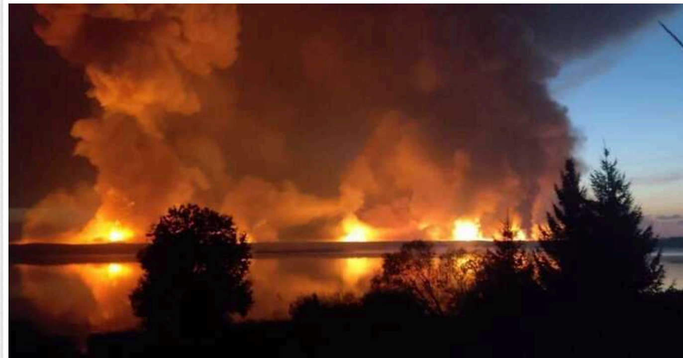
В Z-блогерів удар по Торопцю викликав істерику: у ISW оцінили ефект, який матимуть подальші атаки на логістичні об'єкти РФ

Українські сили 18 вересня здійснили успішну атаку беспілотниками на російський склад ракет і боеприпасів поблизу Торопця в Тверській області. Після першого удару на військовому об'єкті почалися повторні вибухи, що призвело до значних пошкоджень та втрат озброєння.