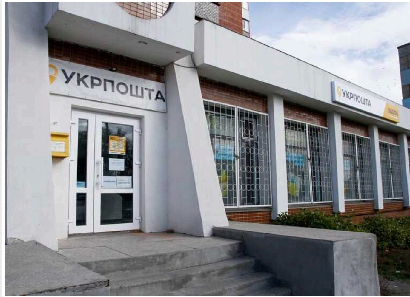
"Укрпошта" почала розсилати перші 6000 повісток без участі ТЦК

17 вересня вперше відбувся централізований обмін повістками в електронному форматі. Загалом Укрпошта отримала близько шести тисяч повісток для виклику військовозобов'язаних до ТЦК.