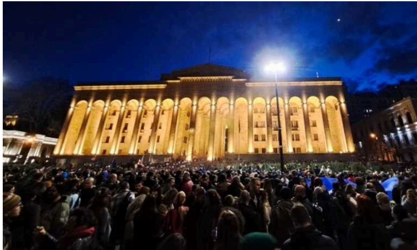
Грузія здалася Путіну: які неочевидні зараз проблеми постануть перед нами після війни

26 жовтня у Грузії відбудуться перші парламентські вибори в новому форматі – повністю за пропорційною схемою. Партія влади, «Грузинська мрія», прогнозовано прагне втримати владу, яка захиталася після низки гучних скандалів, пов'язаних, зокрема, з колишнім президентом країни Міхеїлом Саакашвілі, який уже не перший рік перебуває за ґратами.