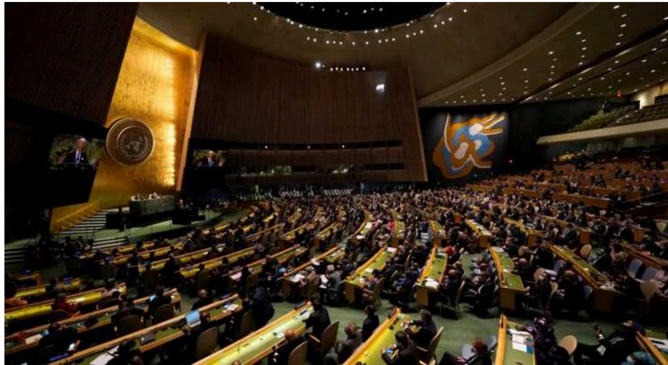
Генасамблея ООН закликала Ізраїль залишити окуповані території

Генеральна асамблея ООН 18 вересня ухвалила резолюцію, яка закликає Ізраїль залишити Сектор Гази та окупований Західний берег річки Йордан протягом 12 місяців.