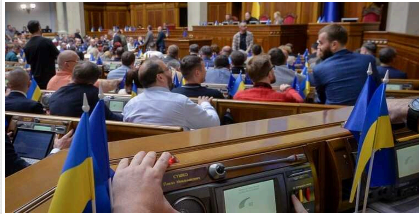
У Верховній Раді запропонували штрафувати мобільних операторів за поганий зв'язок під час відключень світла

Комітет Верховної Ради з питань цифрової трансформації виступив з рекомендацією про перше читання законопроекту №11431. Цей законопроект спрямований на забезпечення стабільної роботи мобільних операторів в умовах відключень електроенергії.