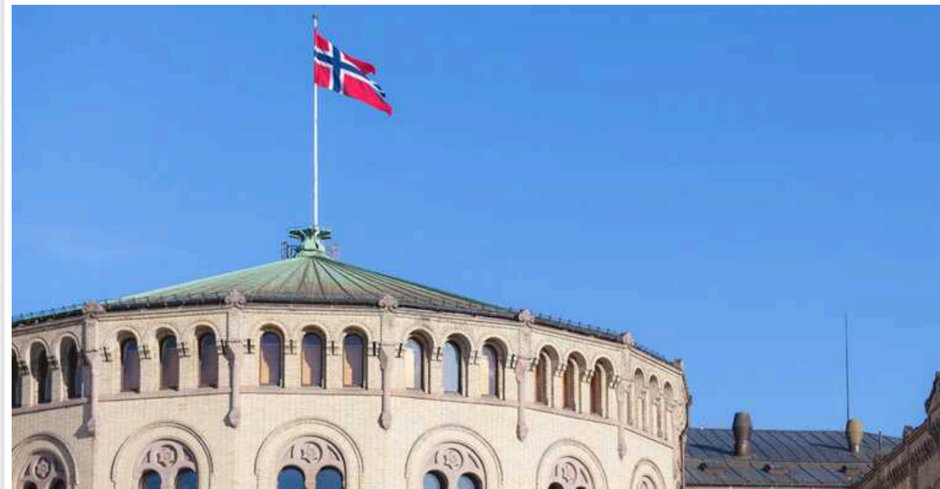
Через лісову пожежу біля Чорнобиля в Норвегії заявили про підвищений рівень радіації

Норвегія оголосила про підвищений рівень радіації через лісову пожежу неподалік від Чорнобиля.