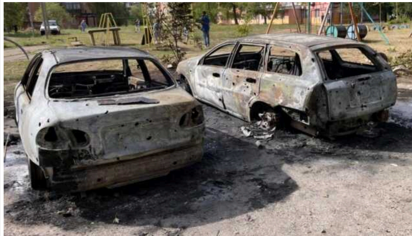
Окупанти здійснили атаку на два райони Дніпропетровщини: один загиблий, 4 травмованих

Військові РФ протягом дня кілька разів завдали ударів по Нікопольському та Криворізькому районам.