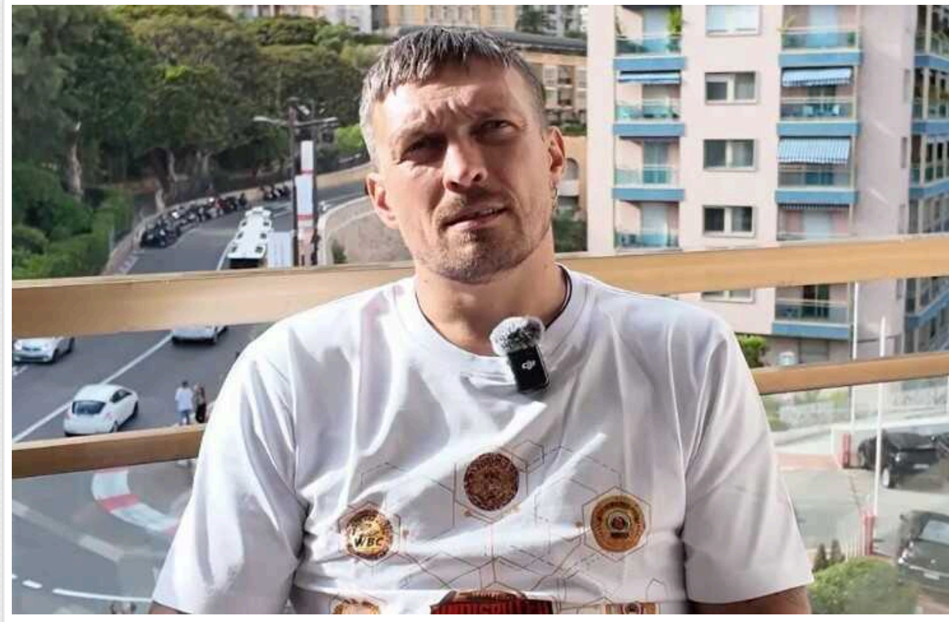
Польська влада вперше прокоментувала, чому в Кракові Усика закували в кайданки

Колишнього абсолютного чемпіона світу в суперважкій вазі Олександра Усика затримали в аеропорту "Краків" відповідно до процедури - це був превентивний захід. Наш співвітчизник нібито був дуже незадоволений своїм затриманням польськими прикордонниками, через що не зміг вилетіти до Валенсії.