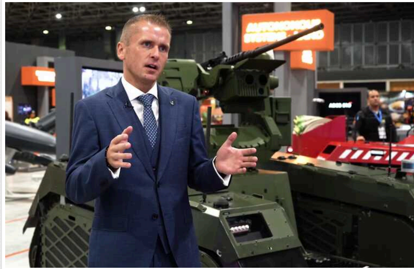
Естонська компанія Frankenburg Technologies розпочне виробництво ракетних систем в Україні

Естонська оборонна компанія Frankenburg Technologies повідомила про початок виробництва протидронових ракетних систем в Україні.