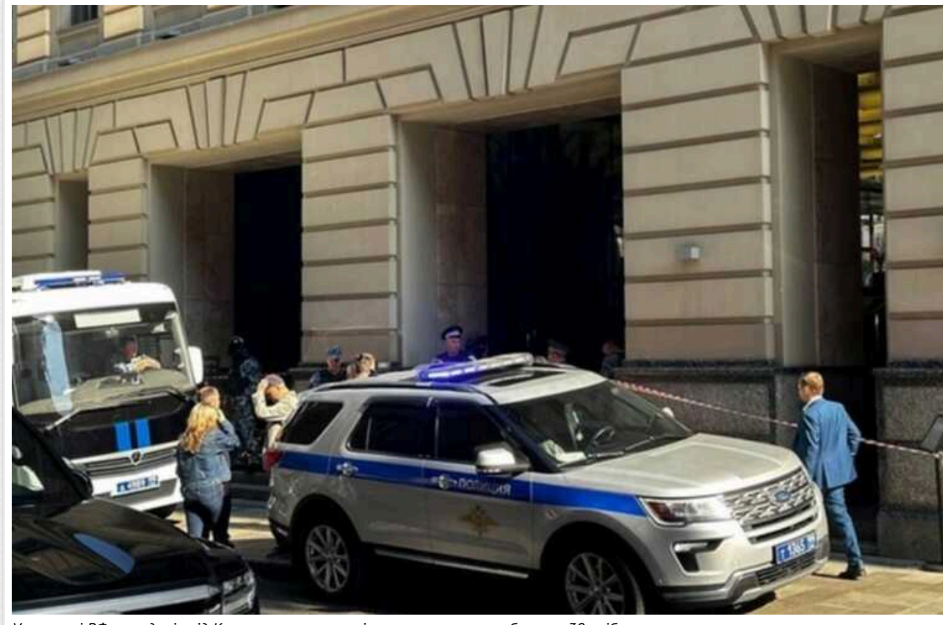
У столиці РФ, неподалік від Кремля, сталася стрілянина: затримано близько 30 осіб

У середу, 18 вересня, в столиці РФ Москві сталася стрілянина. Відомо про одного загиблого та десятки затриманих.