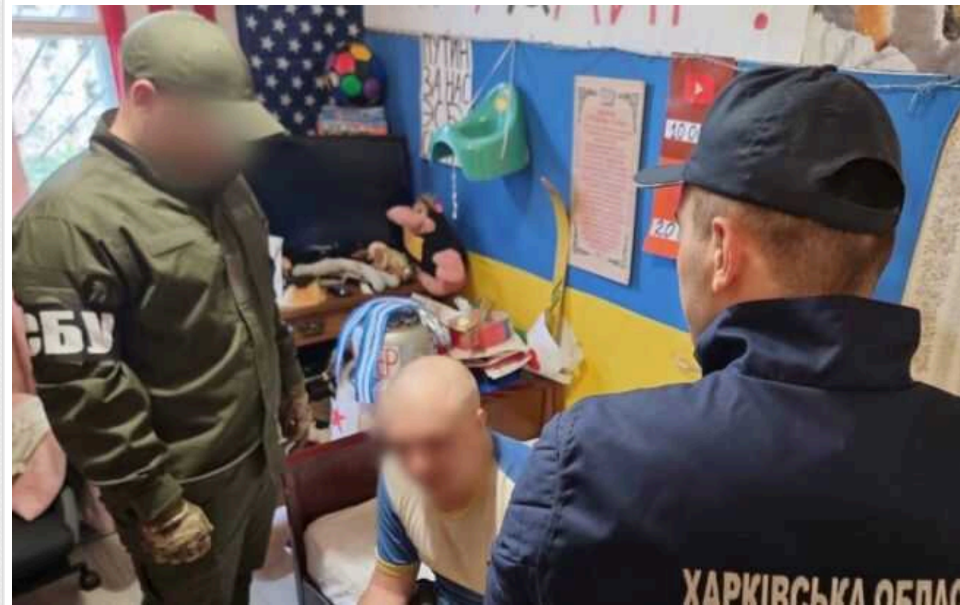
У Харкові відбудеться суд над "блогером" за популяризацію комуністичних та російських ідей

Новобаварська окружна прокуратура Харкова передала до суду обвинувальний акт стосовно 25-річного місцевого жителя, якого підозрюють у виготовленні та розповсюдженні матеріалів, що виправдовують агресію Росії проти України.