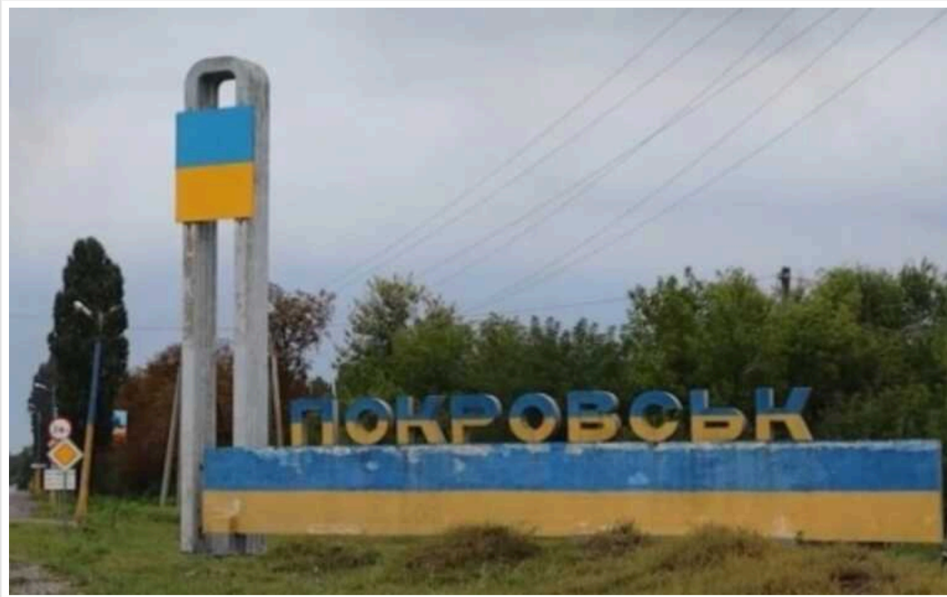
У Покровську проживає 16 000 осіб, 177 із них - діти

У місті Покровськ Донецької області залишається 16 тис. людей, 177 із них - діти. Евакуація триває.