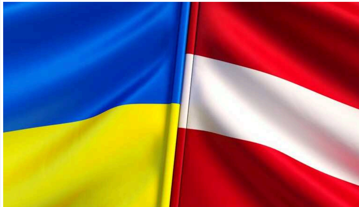
Литва має намір виділити 10 мільйонів євро на виробництво українського ракетного комплексу «Паляниця»

У 2023 році Литва має намір надати Україні військову допомогу в обсязі 40-50 млн євро, з яких 10 млн євро буде вкладено у виробництво ракетного безпілотного комплексу «Паляниця».