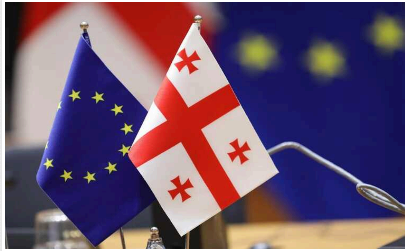
В Європейському Союзі закликали Грузію скасувати пакет антиЛГБТ-законопроектів

Високий представник ЄС Жозеп Боррель закликав Грузію скасувати ухвалений напередодні пакет антиЛГБТ-законопроектів.