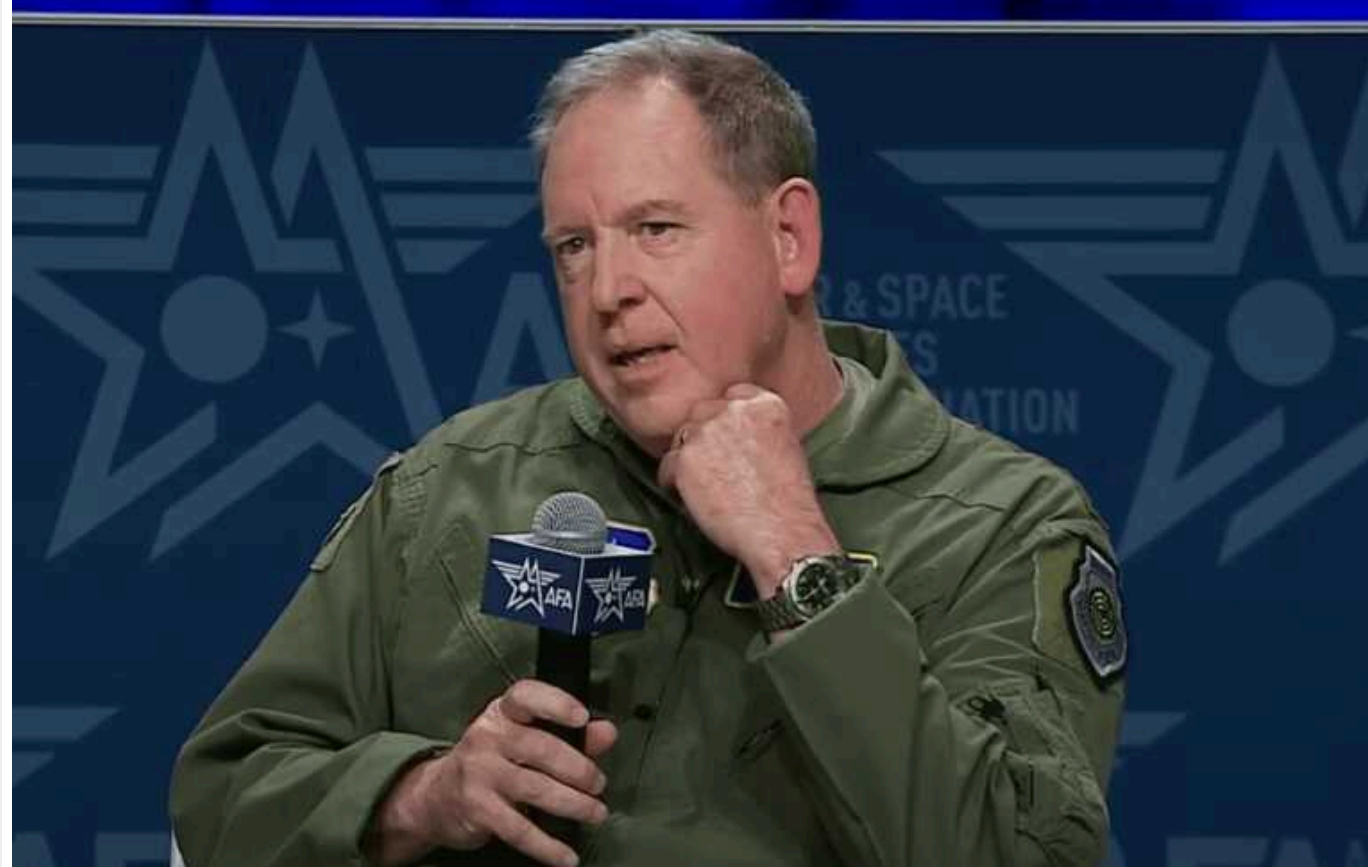
Армія РФ більша та сильніша, ніж була до початку війни в Україні, – генерал ВПС США

Російська армія тепер є більшою та сильнішою, ніж була до вторгнення в Україну в лютому 2022 року.