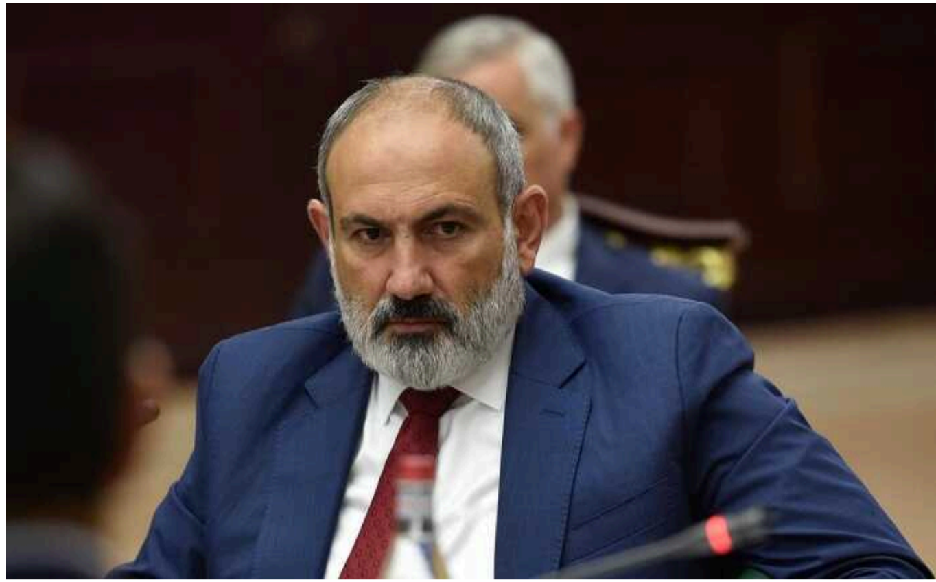
Прем'єр Вірменії назвав ОДКБ загрозою для державності країни

Прем'єр-міністр Вірменії Нікол Пашинян зазначив, що Єреван має багато невіршених питань щодо Організації Договору колективної безпеки (ОДКБ), і що він вважає її загрозою для державності своєї країни.