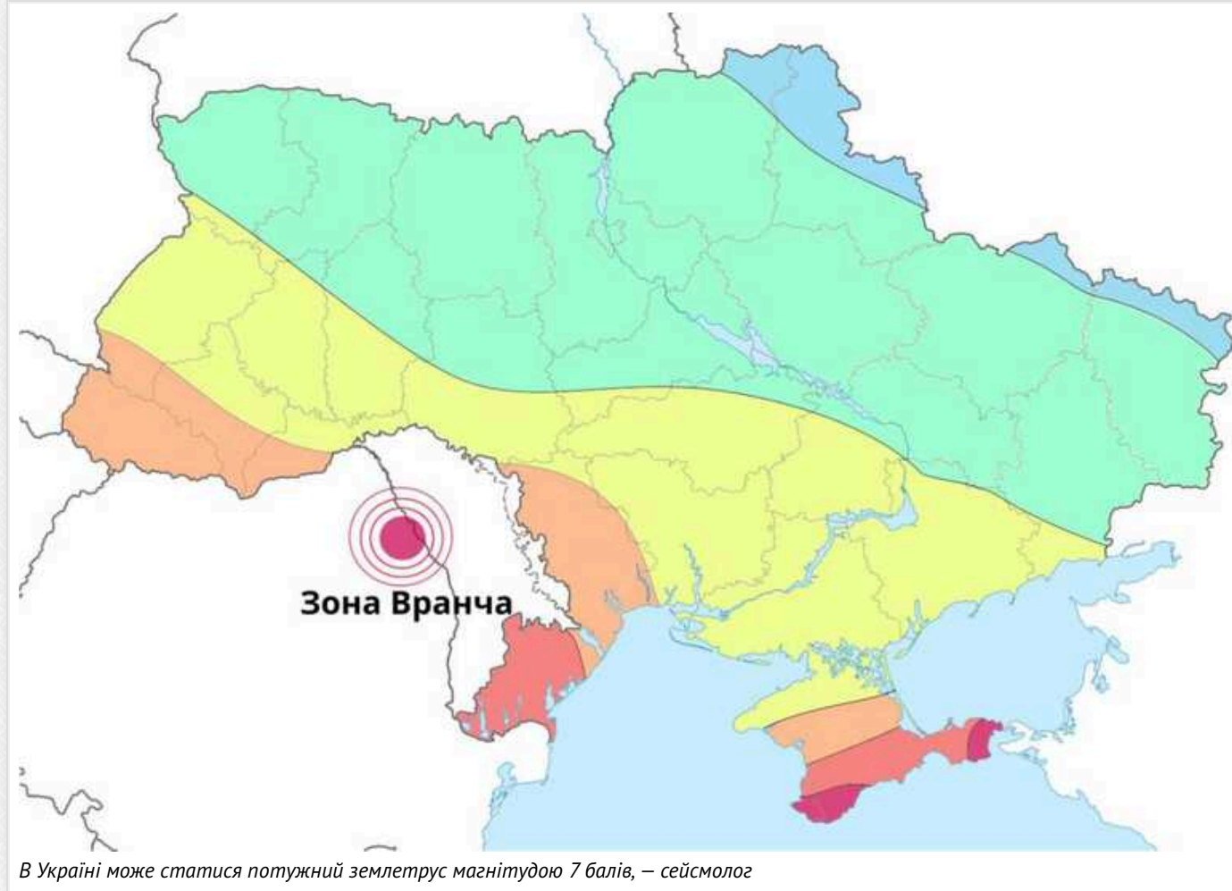
В Україні може статися потужний землетрус магнітудою 7 балів, – сейсмолог

Сейсмолог стверджує, що передбачити точний час та силу землетрусу неможливо.