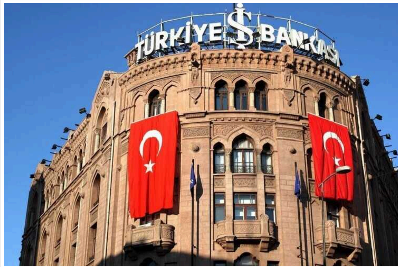
Турецькі банки почали блокувати платежі з Росії до Європи

Банки Туреччини почали активно відмовляти російським компаніям у здійсненні платежів до Євросоюзу та інших країн.