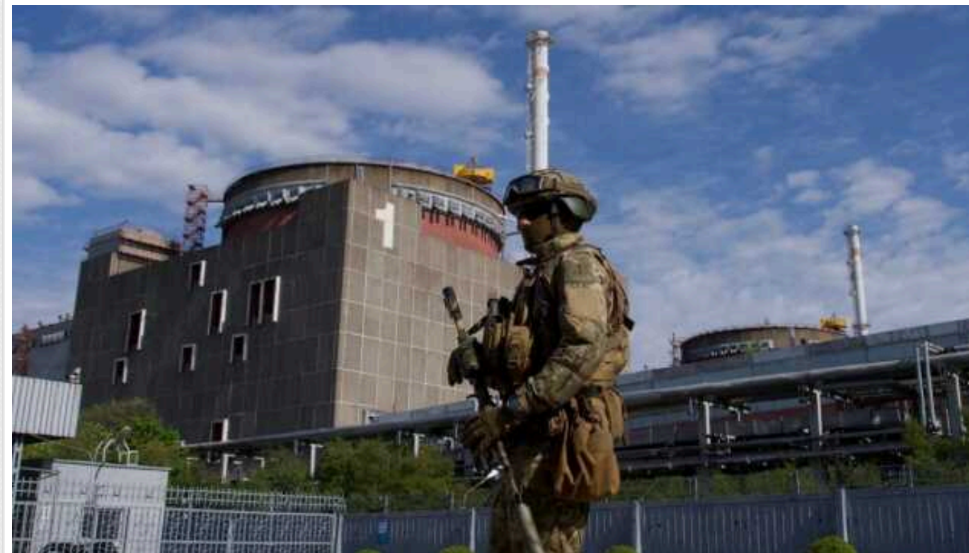
На Запорізькій АЕС є російські окупанти та техніка, а по периметру встановлені міни, - МАГАТЕ

На території Запорізької АЕС, яку окупувала Росія, перебувають озброєні особи та техніка, що ускладнює доступ місії МАГАТЕ. А між внутрішньою та зовнішньою огорожею об'єкта встановлено протипіхотні міни.