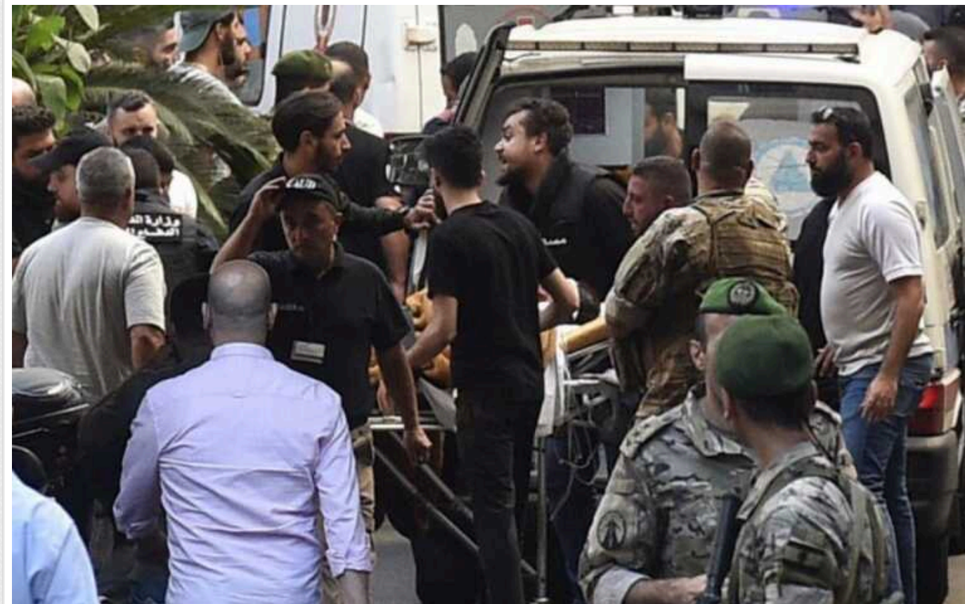
Виробником пейджерів, які вибухнули в Лівані, є угорська компанія, - ЗМІ

Угорська компанія виготовила пейджери, які вибухнули в Лівані та Сирії, убивши щонайменше дев'ятьох осіб і поранивши тисячі членів угруповання "Хезболла".