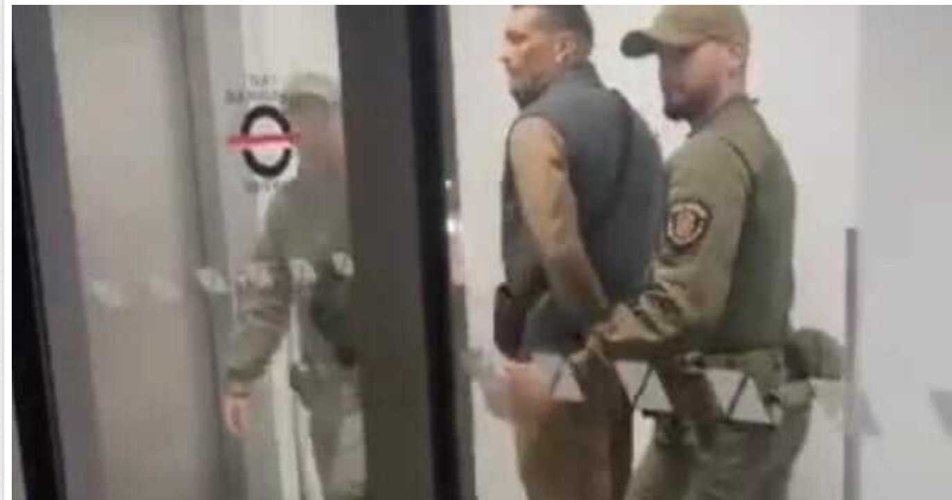
У Польщі прикордонники заявили, що не затримували Олександра Усика в Краківському аеропорту, – ЗМІ