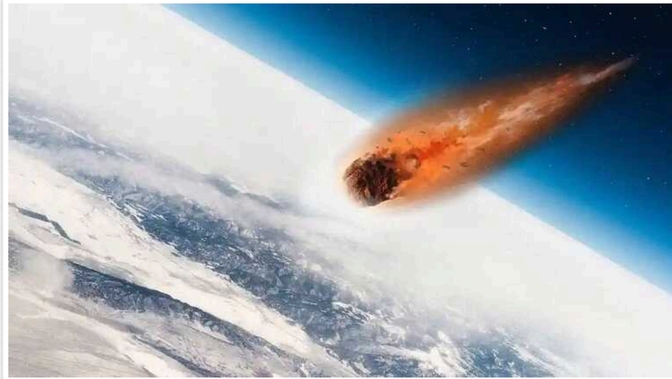
У 2029 році великий астероїд може знищити декілька мегаполісів на Землі та змінити клімат планети, — вчені

«Апофіс» – це астероїд, який потенційно становить небезпеку. Його діаметр складає приблизно 340 метрів, що робить його майже таким же великим, як Ейфелева вежа.