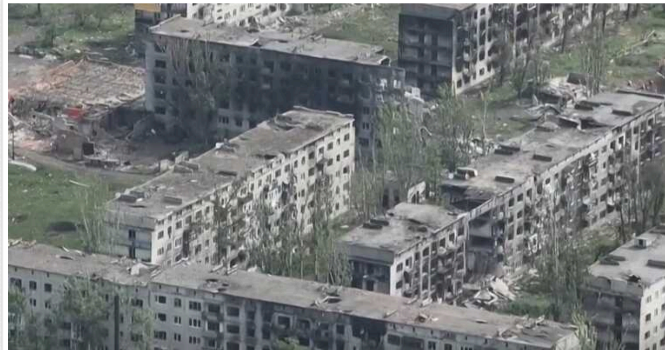
У ЗСУ розповіли, яку частину Часового Яру контролюють окупанти

Військові сили України контролюють 90% території міста Часів Яр у Донецькій області, де вже декілька місяців точаться запеклі бої.