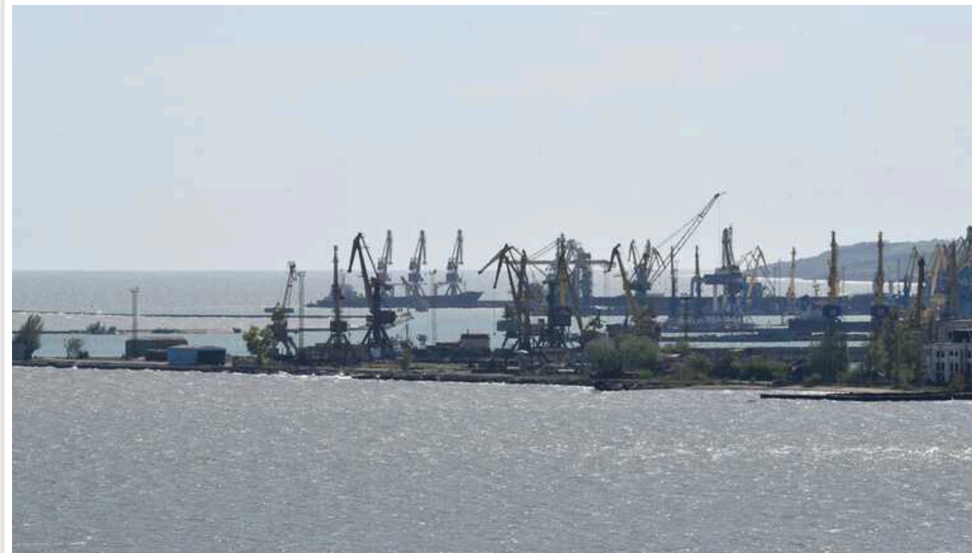
РФ хоче використовувати водні перевезення між Ростовом і окупованим Маріуполем