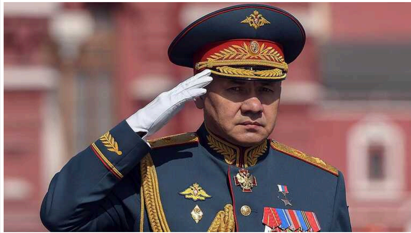
В ISW пояснили навіщо Шойгу прибув в Іран після візитів у Сирію і КНДР

У вівторок, 17 вересня, секретар Ради безпеки Росії Сергій Шойгу відвідав Іран з неанонсованим візитом після недавніх поїздок до Сирії та Північної Кореї. Основною метою Кремля є створення коаліції дружніх країн, яка зможе підсилити оборонно-промислову базу Росії.