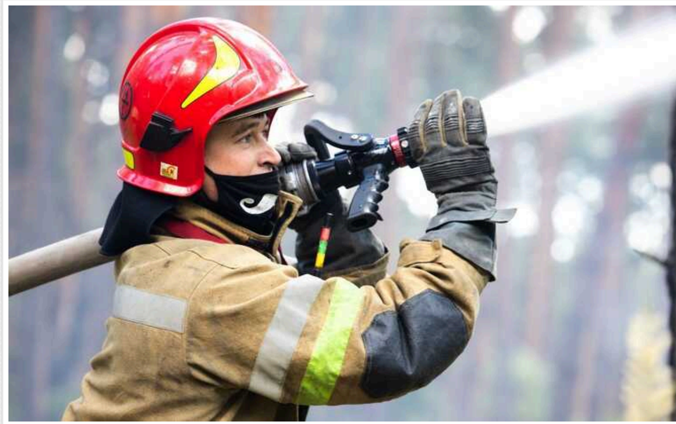
Окупанти вдарили по енергооб'єктах в Сумах: триває ліквідація наслідків

Війська Росії в ніч проти 18 вересня здійснили авіаудар "шахедом" по місту Суми. Ціллю були енергетичні об'єкти, за попередніми даними, постраждалих немає.