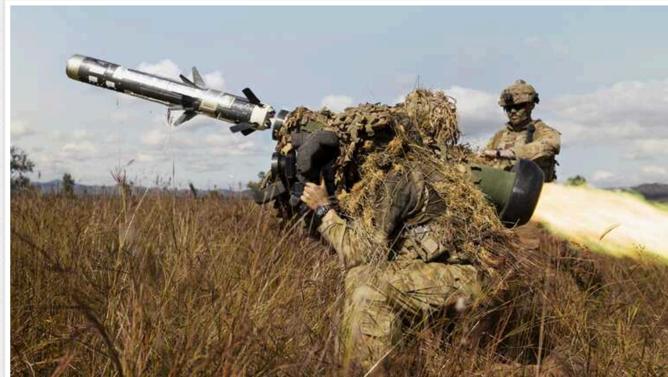
В Defense Express пояснили, навіщо ЗСУ почали розбирати Javelin на запчастини

Бійці ЗСУ вимушені розбирати американський переносний протитанковий ракетний комплекс Javelin. Це робиться заради бойової частини для FPV-дронів. Про це пише видання Defense Express.