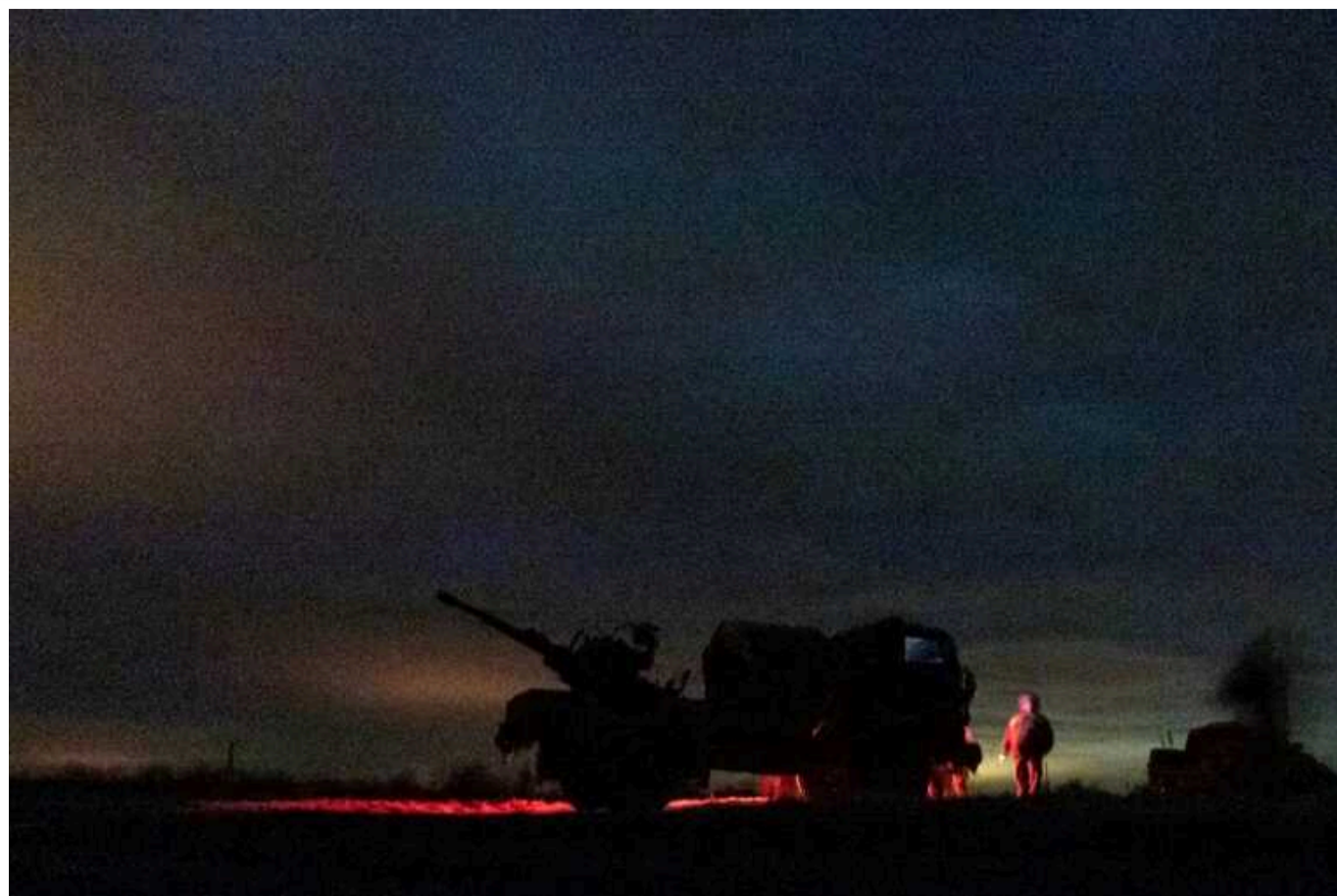
У Київській області працює ППО: повідомляють про вибухи

У Київській області в ніч на 18 вересня було активовано роботу Сил та засобів протиповітряної оборони. Це сталося через виявлення в регіоні ворожих дронів-камікадзе.