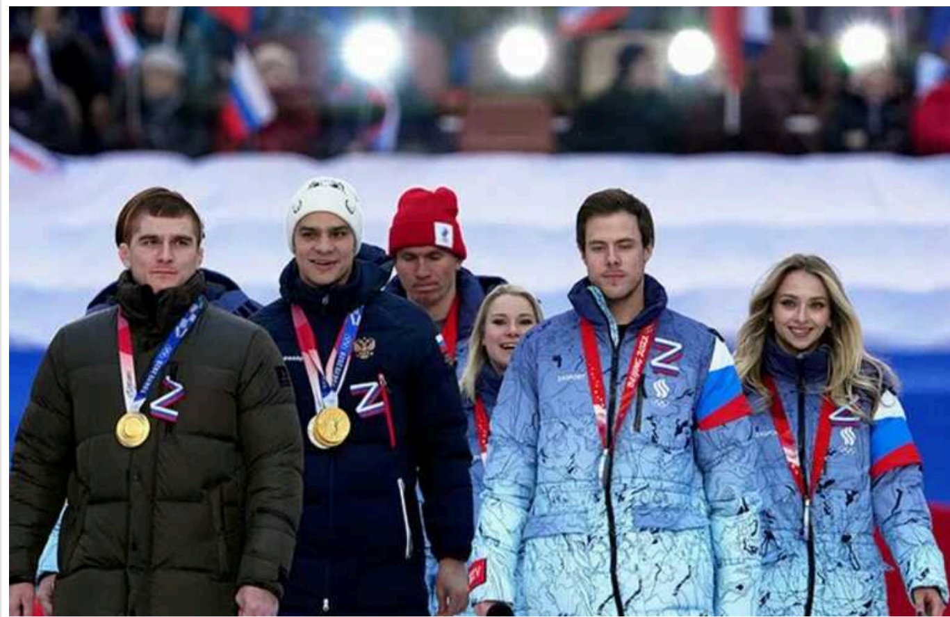
Лаврова жорстко розкритикували після його слів про агресію Заходу в спорті

Міністр закордонних справ РФ Сергій Лавров звинуватив Міжнародний олімпійський комітет (МОК) та Всесвітнє антидопінгове агентство в "політизації спорту", повторивши традиційні та безглузді нарративи кремлівської пропаганди. Ця заява викликала сміх та відверте знуцання з боку вболівальників.