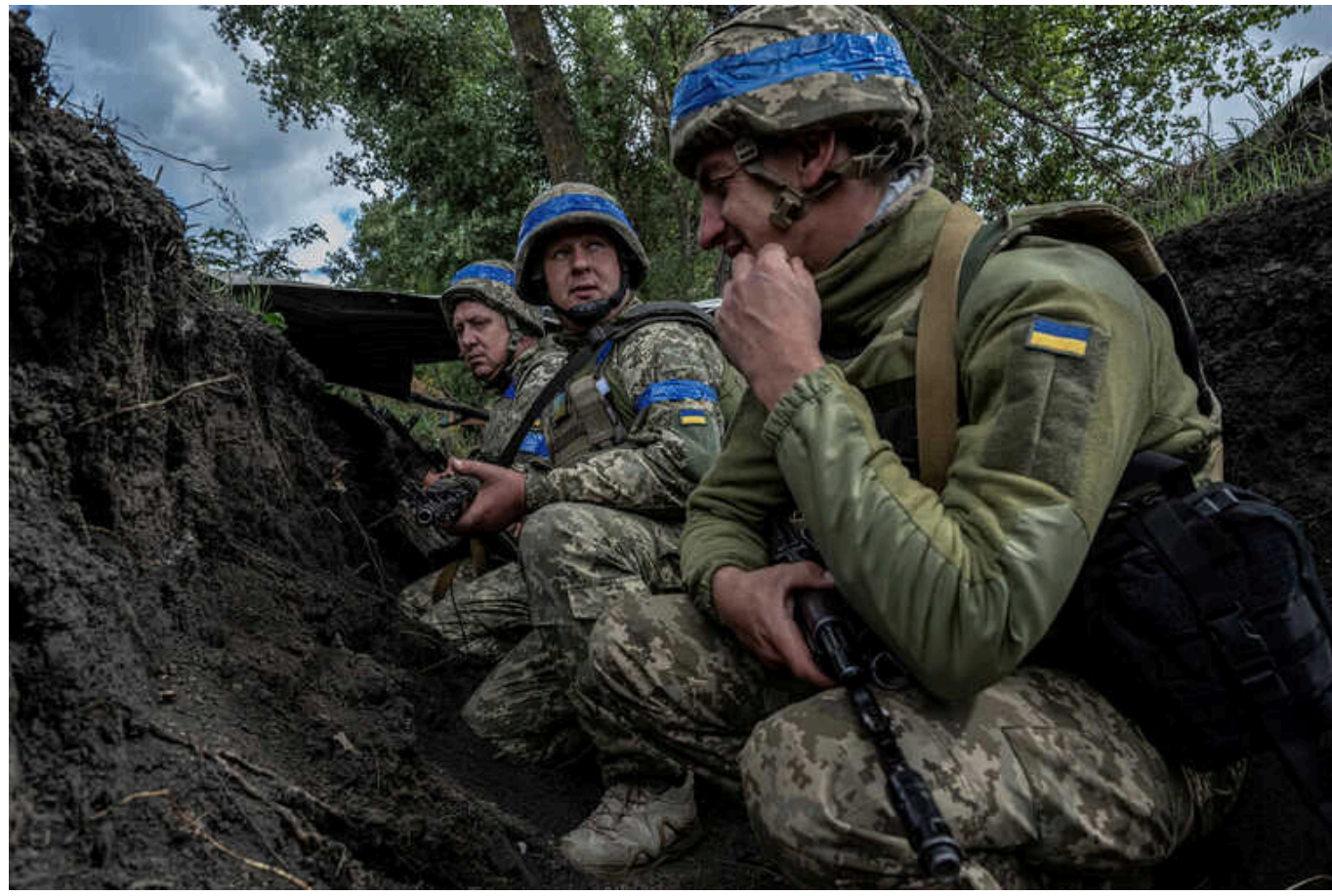
У Курській області ЗСУ захопили в полон ще 13 росіян

У Курській області сили оборони захопили в полон понад десять російських військових. Після п'яти днів запеклих боїв окупанти самі підняли білий прапор, оскільки залишилися без води та боєприпасів.