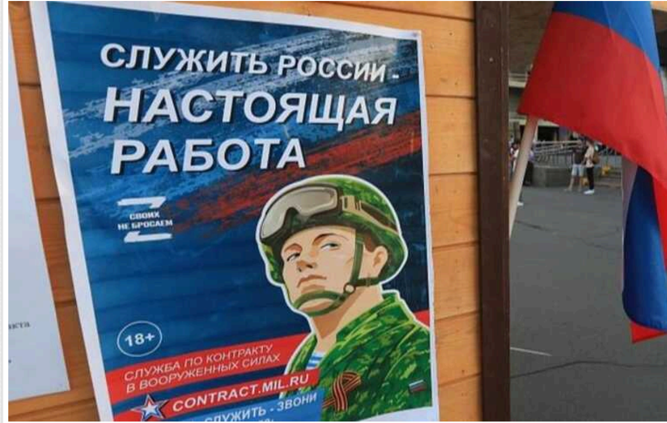
В окупованому Маріуполі росіяни роздають школярам брошури з рекламою служби в ЗС РФ

На тимчасово окупованих Росією територіях продовжується мілітаризація молоді, зокрема школярів. Так, у школах Маріуполя окупанти роздають дітям брошури, що рекламують службу в російській армії.