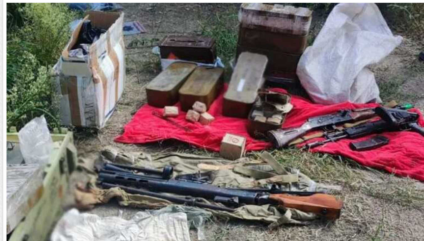
Київські правоохоронці викрили «бізнес» з продажу зброї та вибухівки

Столицькі правоохоронці викрили "бізнес" з незаконного продажу автоматичної зброї, вибухівки та наборів різного калібру, організований трьома жителями Київщини. Під час обшуків у них було вилучено "товару" на майже 1,7 млн грн.